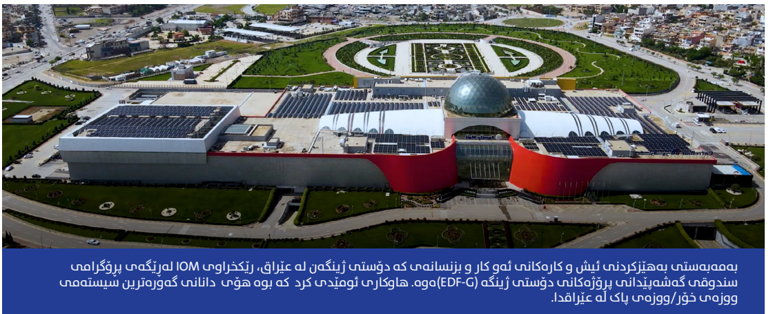
بەھەمىستى بەھىزكرىدنى ئىش و كارەكانى ئەو كار و بىزسانەنى كە دۆستى ژىنگە لە غىراق، رىكخراۋى IOM لەرېگەمى پىرۇگراممى سندوقى گەشەپىدانی پىرۇۋەكانى دۆستى ژىنگە (EDF-G) ۋە ھاۋاكارى ئومىدى كىد كە بوە ھۆمى دانانامى گەۋرەتارىن سىستەمى ووزەمى خۇر/ووزەمى پاك لە غىراقدا.

ئەم پىۋەر و بىنەماپانەنى دۆستى ژىنگە لەرېگەمى قۇناغە جىباجىيانكى سندوقى گەشەپىدانی پىرۇۋەكانەۋە زىاتىر دىنبايى لىدەكرىتەۋە، ھەر لە قۇناغە دەرىپىن تارەزو لە سەرەتا دا تادەگاتە دۋابەمىن قۇناغەكانى دوۋپاتكرىدەۋە و پىشتراستكرىدەۋە دىنباپونەۋە لە ئەنجامدانى كارەكان، كە تىپاندا پىشكىن بۇ بەئەنجامگەباندنى چالاكىبەكانى ئەو كار و بىزىس و كۆمپانىياپانە دەكرىت بۇ دىنباپونەۋە لەھەمى كە دۆستى ژىنگەن. بەلەبەرچاۋىرتى ئالۇزى ئەم بوارە و ئەگەرى ھەبۋونى ھەندىك خاۋەنكارى تازە كە ھىچ ئەزمۋونىكى پىشۋوبان نىبە بۇ گىرتتەبەرى رىچكەمى دۆستى ژىنگە، بۇبەش